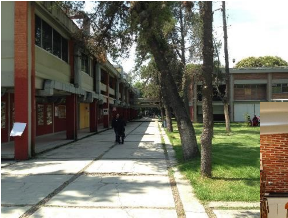
↑キャンパスの様子