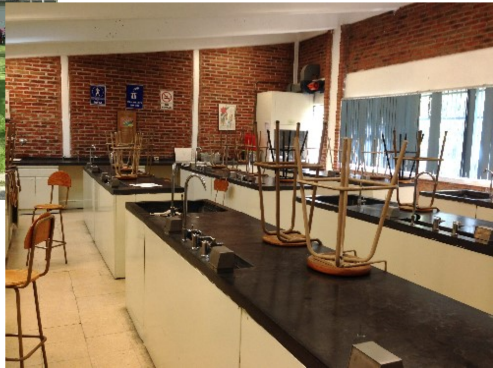
→実験室の様子 設備は日本の方が充実しているようです。