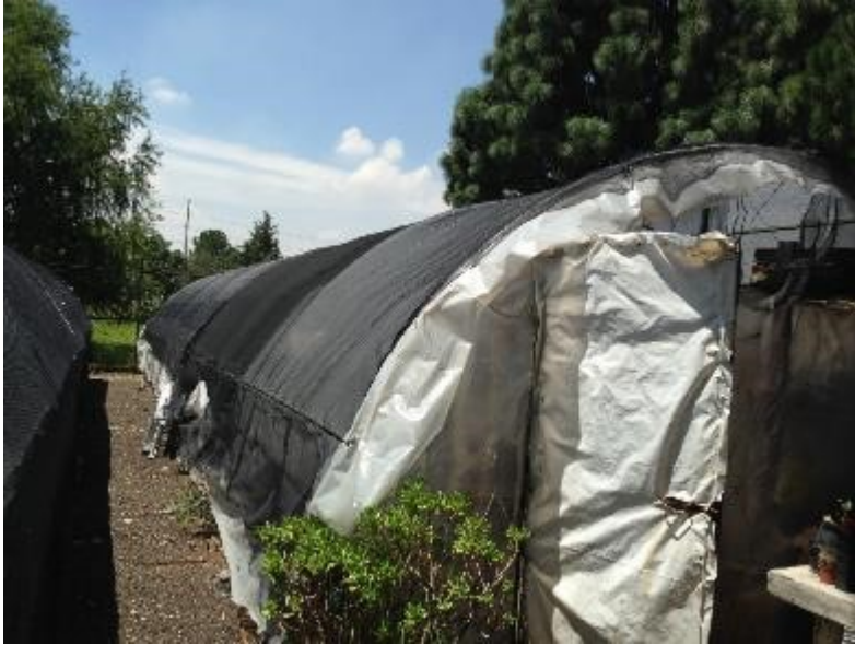
温室の外観(遮光されていました)