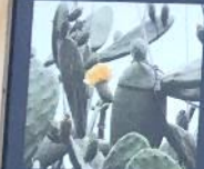
静岡市指定文化財 大仙人尊(サボテン)