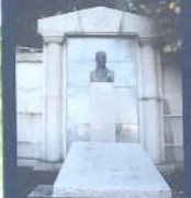
明治の文豪 高山樗牛の墓(シカヤマキウキウ)