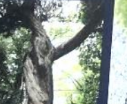
樹齢800年の神木 ハウススポット 換柏(シンバク)