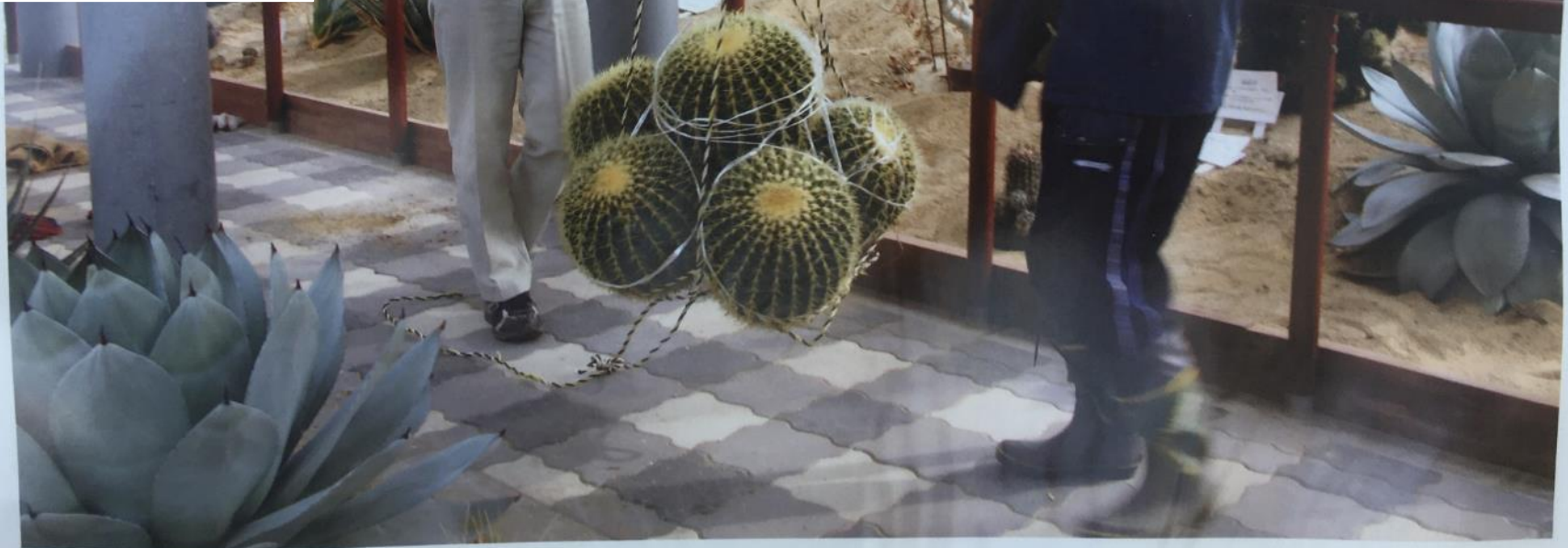
い どう よう す サボテンを移動する様子