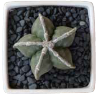
星型が目を引く存在感のある形

白糸鸞鳳玉 はくじょうらんぼうぎよく 通常は肌全体に白点があるサボテンですが、交配により白点の角の部分だけに残った「白糸タイプ」と呼ばれる品種です。