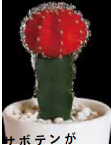
2つのサボテンが合体してる?!

「接ぎ木」と呼ばれる技法で、2つのサボテンが合体しています。下の緑色のサボテンから栄養をもらうことで生育することが出来ます。